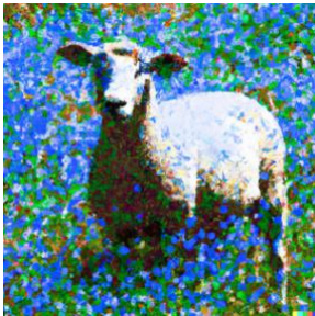
Abbildung 3: “Pointillist painting of a sheep in a sunny field of blue flowers”, Bild generiert von DALL-E, 08.03.2023.