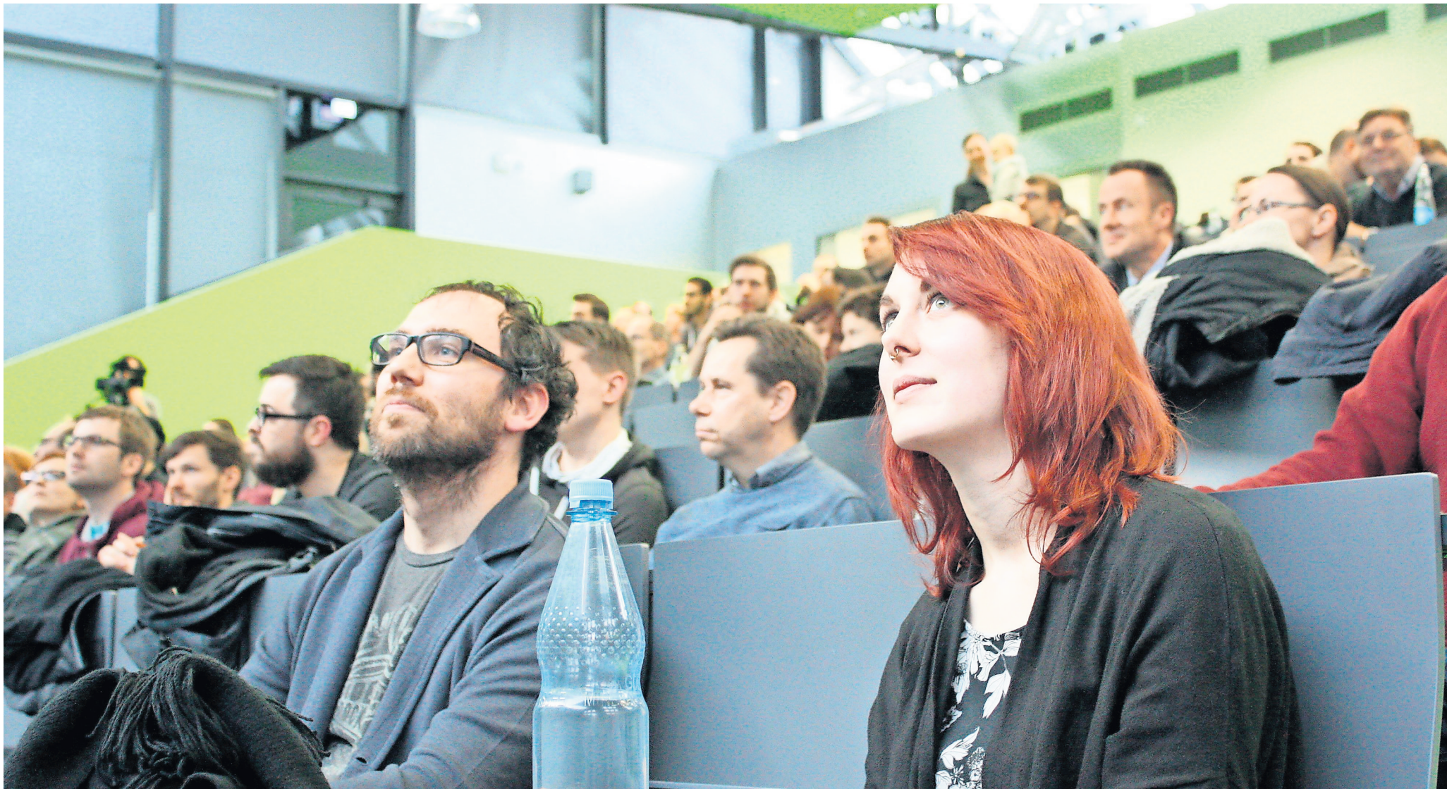
Wie zur Eröffnung der Wissenschaftswoche 2017 wird es auch diesmal wieder kurze Vorträge zu besonderen Projekten an der TH Wildau geben.