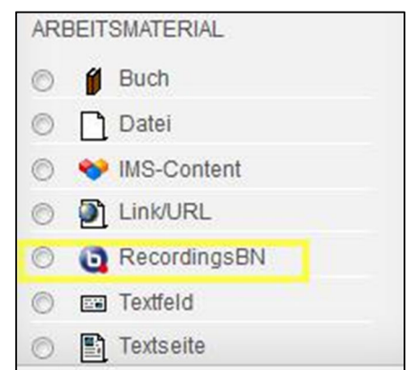
Abbildung 8 – RecordingsBN hinzufügen

Um die Möglichkeit zu haben, die angelegte Session automatisiert aufnehmen zu lassen, muss an dieser Stelle noch das Arbeitsmaterial RecordingsBN hinzugefügt werden (Abb. 8). Sobald dann eine Session gestartet und wieder beendet wird, läuft der Speichervorgang des Systems. Wenn der Vorgang abgeschlossen ist, steht die Aufnahme dann unter diesem Arbeitsmaterial zur Verfügung.