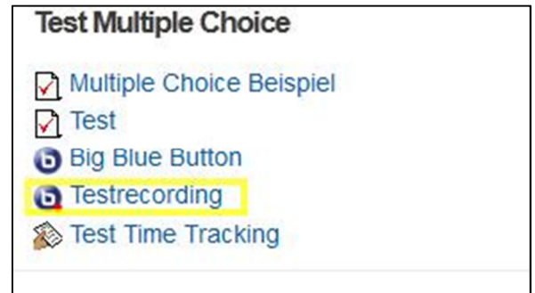
Abbildung 9 – Aufruf der Recording Schaltfläche

Sobald die Sitzung beendet wurde, beginnt der Speichervorgang. Dies kann unter Umständen bis zu 30 Minuten in Anspruch nehmen. Die gespeicherte Session ist dann über den Kursraum auswählbar. Dafür ist es erforderlich die Recording Schaltfläche anzuklicken (Abb. 9).